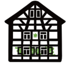
Ressort Mülheimer Eifelhütte